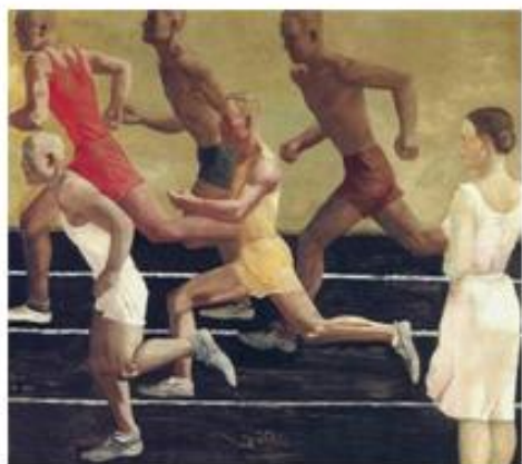
Александр Дейнека «Бегуны»