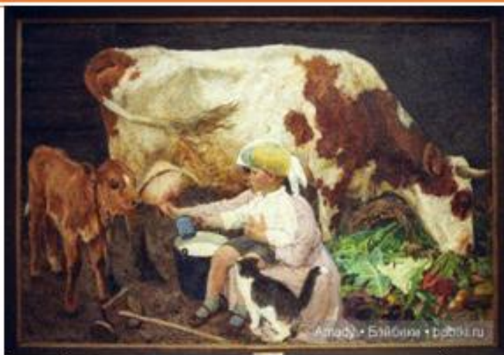
Аркадий Пластов «Кружка молока»