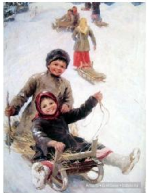
Федот Сычков «Катание с горы»