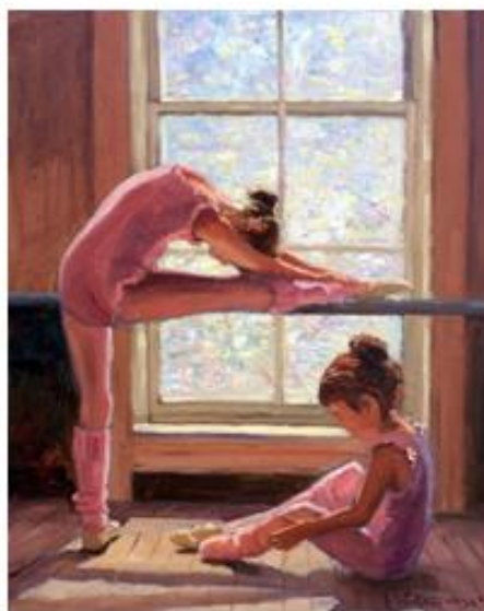
Ролоф Россов «Маленькие балерины»