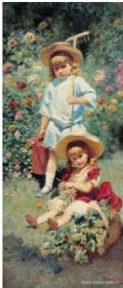
Константин Маковский «Портрет детей художника»