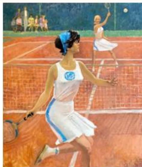
Александр Самохвалов «Теннис»