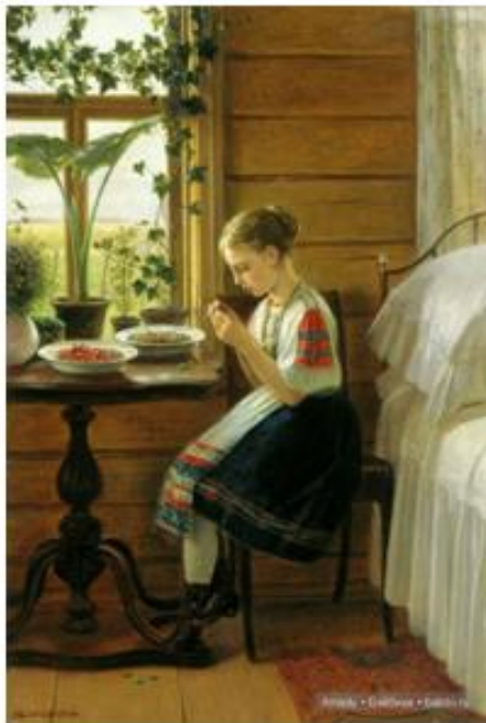
Николай Быковский «На даче»