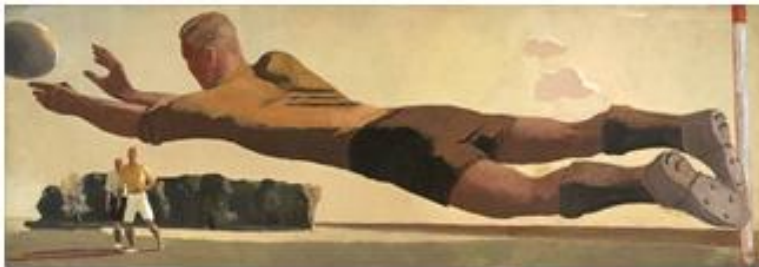
Александр Дейнека «Вратарь»