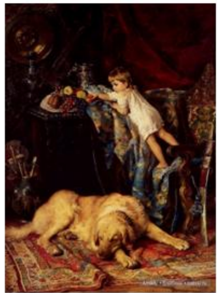
Константин Маковский «В мастерской»