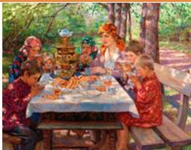
Николай Богданов-Бельский «Чаепитие у самовара»