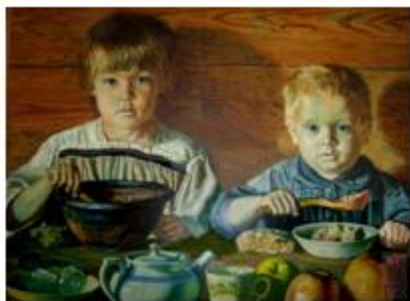
Михаил Климентов «Крестьянские дети»